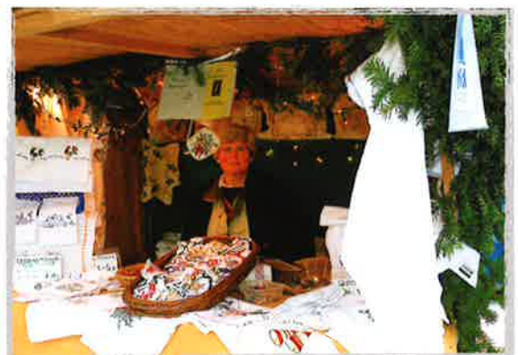
Brigitte Dengler in ihrem Stand auf dem Haderner Weihnachtsmarkt.

Sauerbruchstr. 10, München) erhältlich sind, stellt die rüstige Rentnerin zur Adventszeit ihre Kollektion auf dem Haderner Weihnachtsmarkt selbst aus - auch in diesem Jahr am zweiten Adventswochenende. Unsere Hochachtung und unseren Dank für über 20 Jahre Treue!